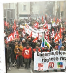
Forte mobilisation des salariés précaires